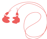
Bouchons moulés individualisés