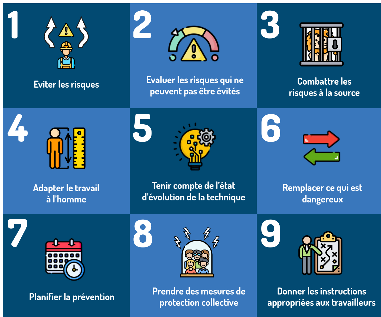
Les 9 principes de prévention

Tout employeur, quelle que soit la taille de l'entreprise, doit désigner depuis le 1er juillet 2012 au moins un salarié compétent pour s'occuper des volets santé