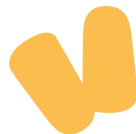
Bouchons à façonner