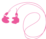
Bouchons moulés individualisés