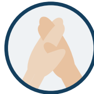
3. Doigts entrelacés et espaces interdigitaux