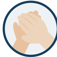
1. Paume contre paume

Prendre une ou deux doses de produit dans le creux de la main en fonction de la taille des mains.