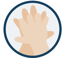
2. Paume contre dos de la main opposée