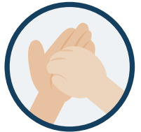
6. Ongles dans la paume opposée