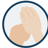
5. Frictions circulaires des pouces