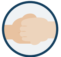
4. Doigts dans la paume de l'autre main